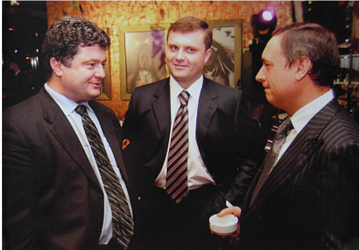
Порошенко, Левочкин, Мартыненко во время революции

– А это вообще другая тема. Мы говорим о том, что происходит после выборов-2006. Перед политиком стоит историческая задача – объединение украинских земель. Продекларировано создание "демократической коалиции". Первое: если она демократическая – она должна быть открыта для всех. Второе: принципиальные разногласия участников коалиции снимаются за столом переговоров. Третье – это межличностные конфликты. Здесь самое большое поле для разногласий. И реально, эти разногласия лежат исключительно в разделе должностей.