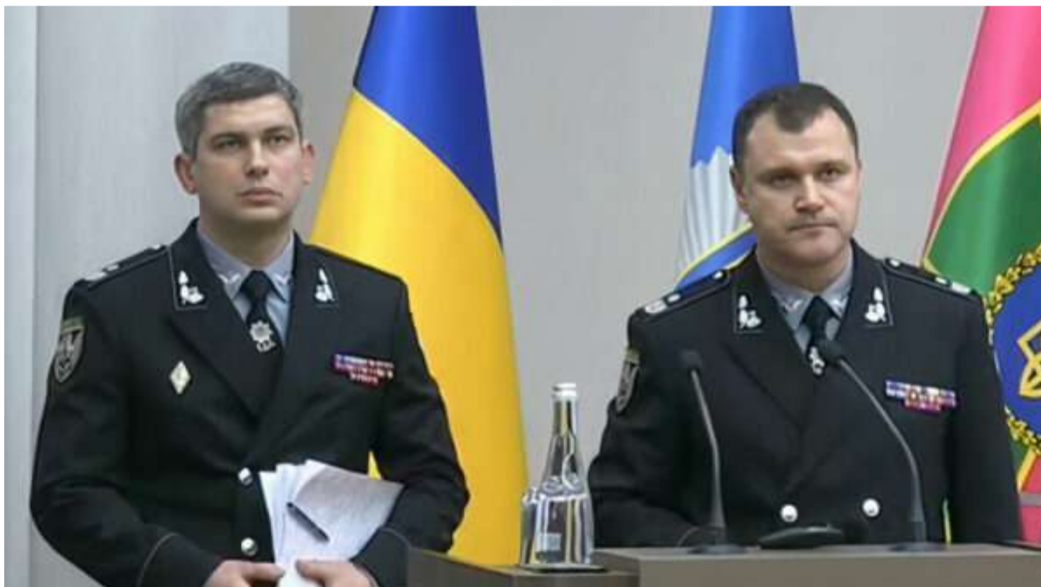
ПОБУТОВІ ПРОБЛЕМИ МІЛЬЙОНЕРІВ З НАЦПОЛУ