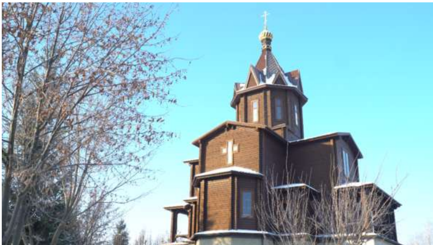
НОТАРІУС У РЯСІ: ЯК ХРАМ ПІД КИЄВОМ ОПИНИВСЯ У ПРИВАТНИХ РУКАХ