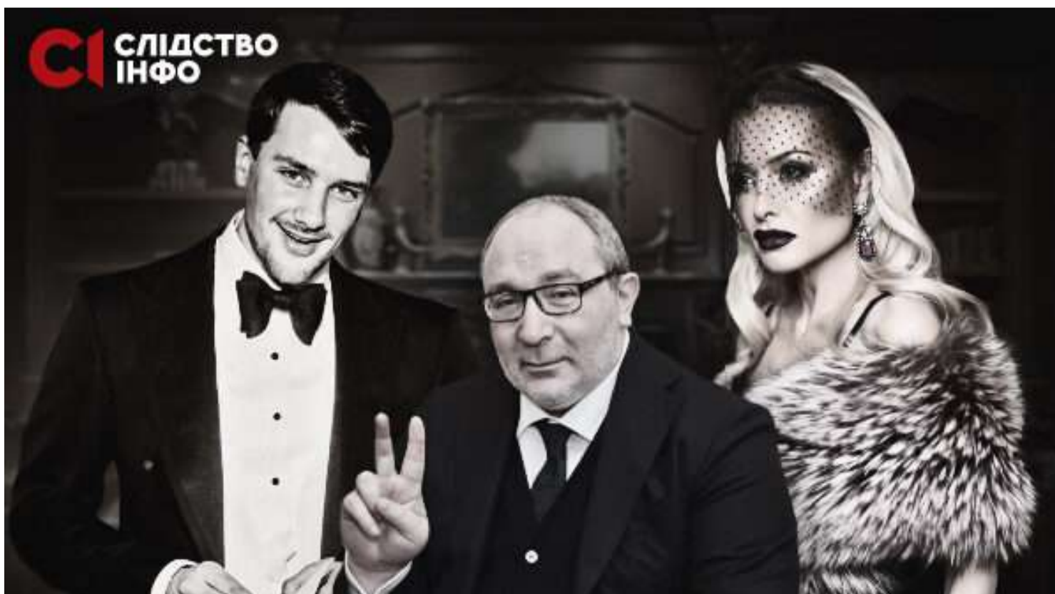
МІЛЬЯРДНИЙ СПАДОК КЕРНЕСА: ЯК СІМ'Я ЕКСМЕРА «ОБРОСТАЄ» БІЗНЕСОМ