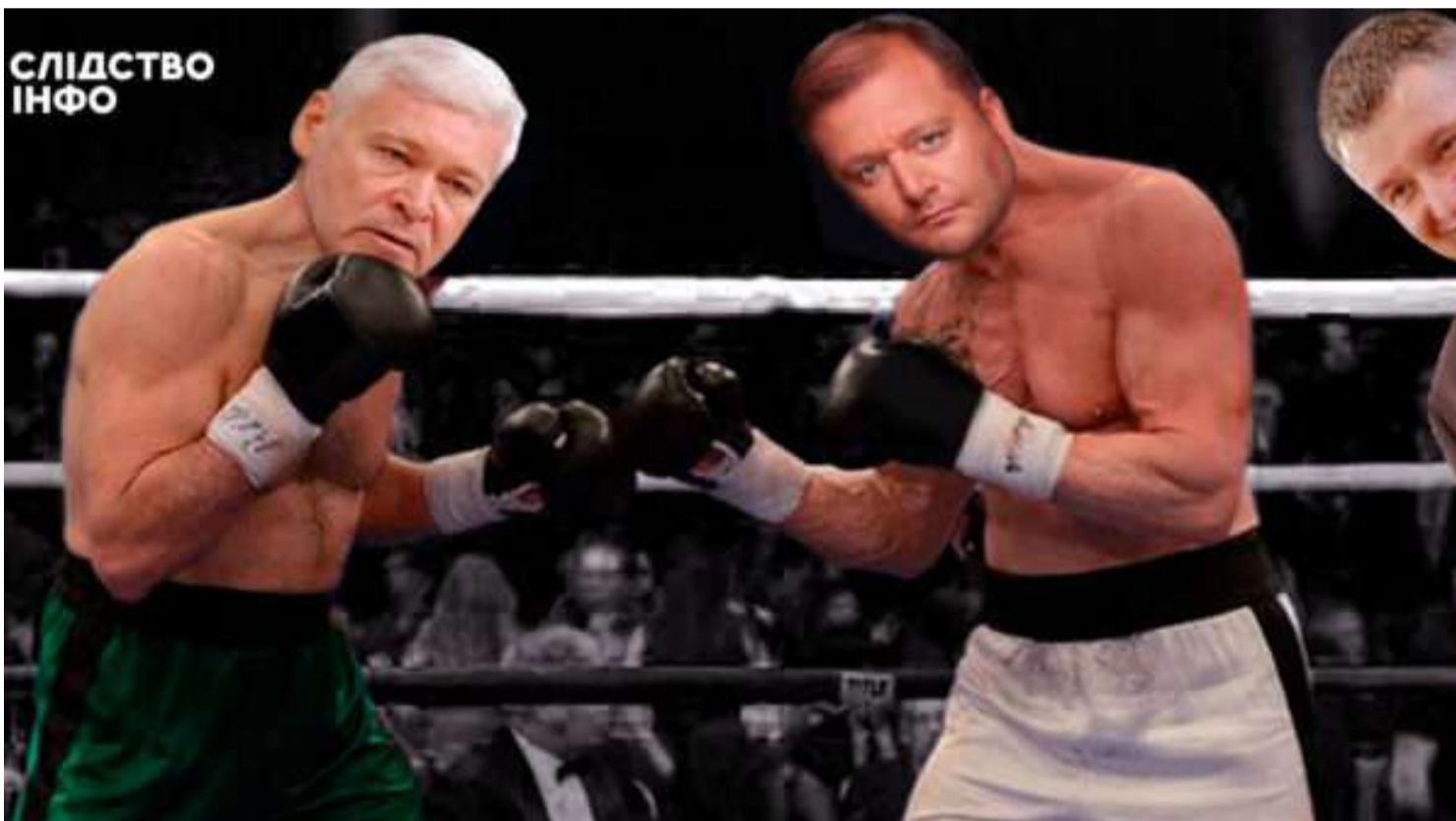
ЗВ'ЯЗКИ З АВАКОВИМ, КРИМІНАЛЬНІ СПРАВИ ТА УСПІШНІ ЖІНКИ: ЩО ВІДОМО ПРО ГОЛОВНИХ КАНДИДАТІВ НА МЕРА ХАРКОВА