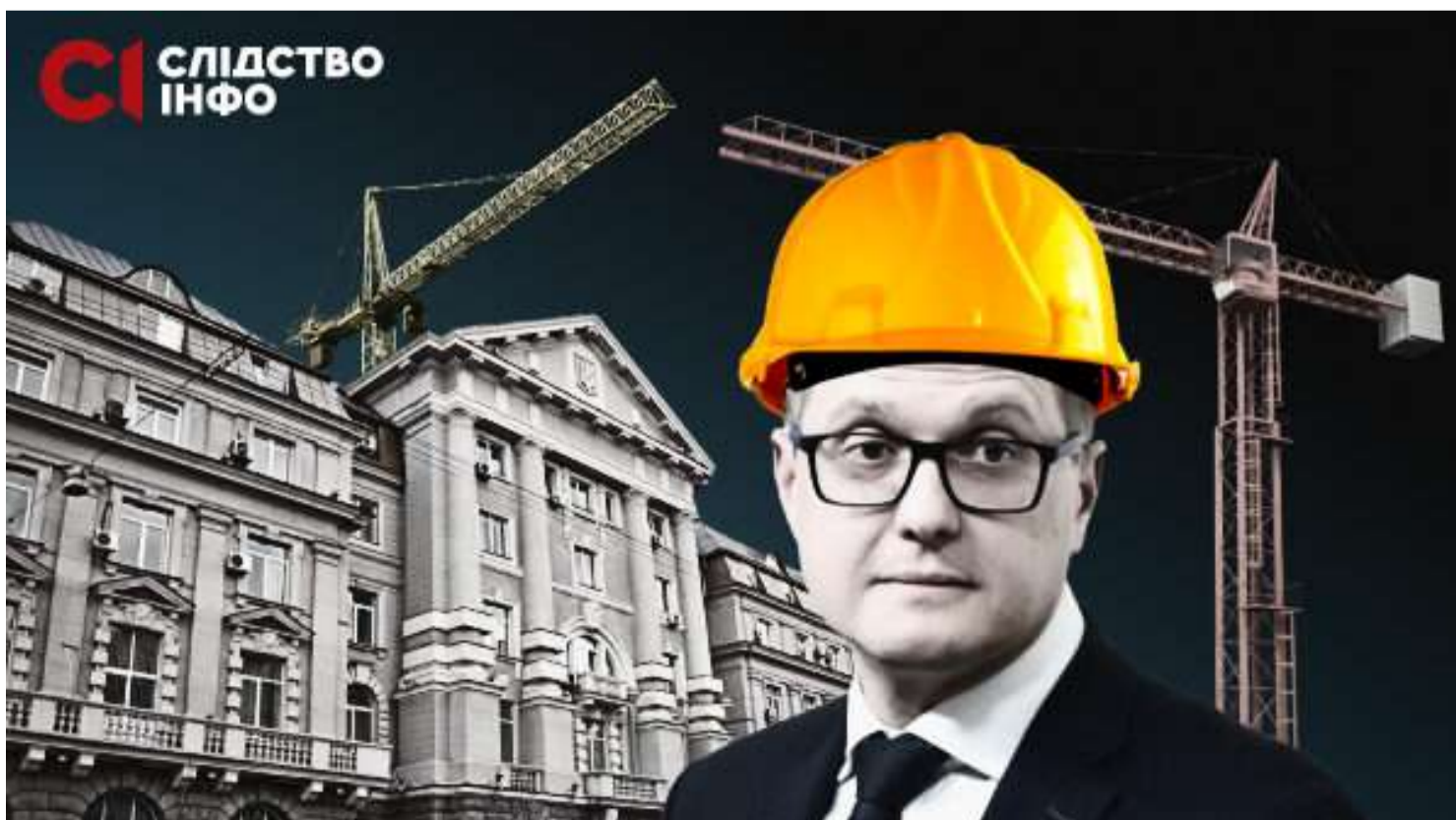
ЦІЛКОМ ТАЄМНІ БУДІВЕЛЬНИКИ. НАВІЩО СБУ ВЛАСНЕ БУДІВЕЛЬНЕ УПРАВЛІННЯ?