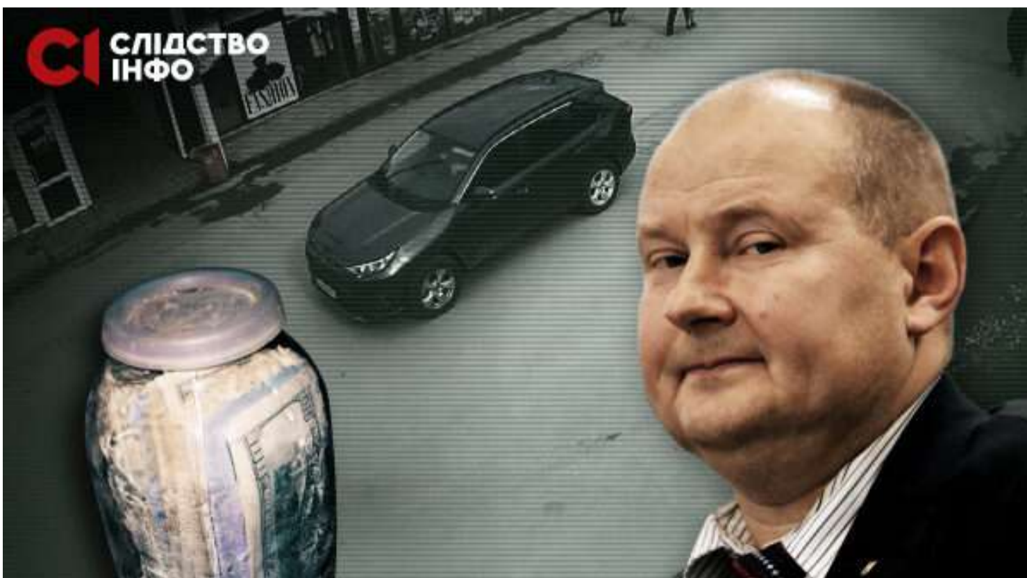
GPS-ТРЕКЕРИ, ДИПЛОМАТИЧНА НОТА, МОЛДОВСЬКЕ ВИНО ТА «ДРУЖНЯ ЗУСТРІЧ». НОВІ ПОДРОБИЦІ У СПРАВІ ВИКРАДЕННЯ МИКОЛИ ЧАУСА