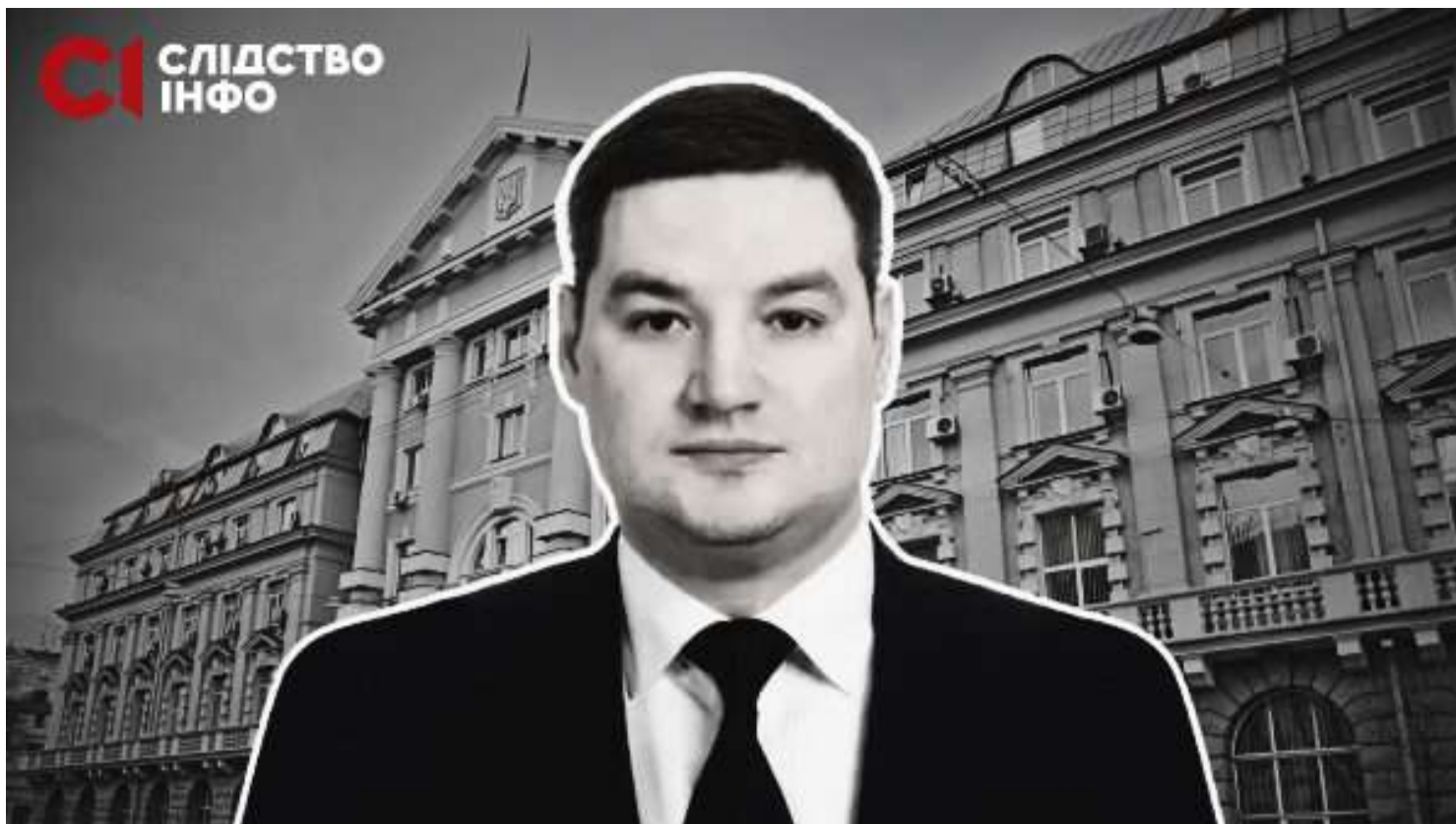
«ПРОСЛУХОВУВАННЯ СУДДІВ БУЛО ЗАВДАННЯМ ВІД ПОРОШЕНКА» – СБУШНИК-ВТІКАЧ ВІДПОВІВ НА ЗАПИТАННЯ «СЛІДСТВА.ІНФО»