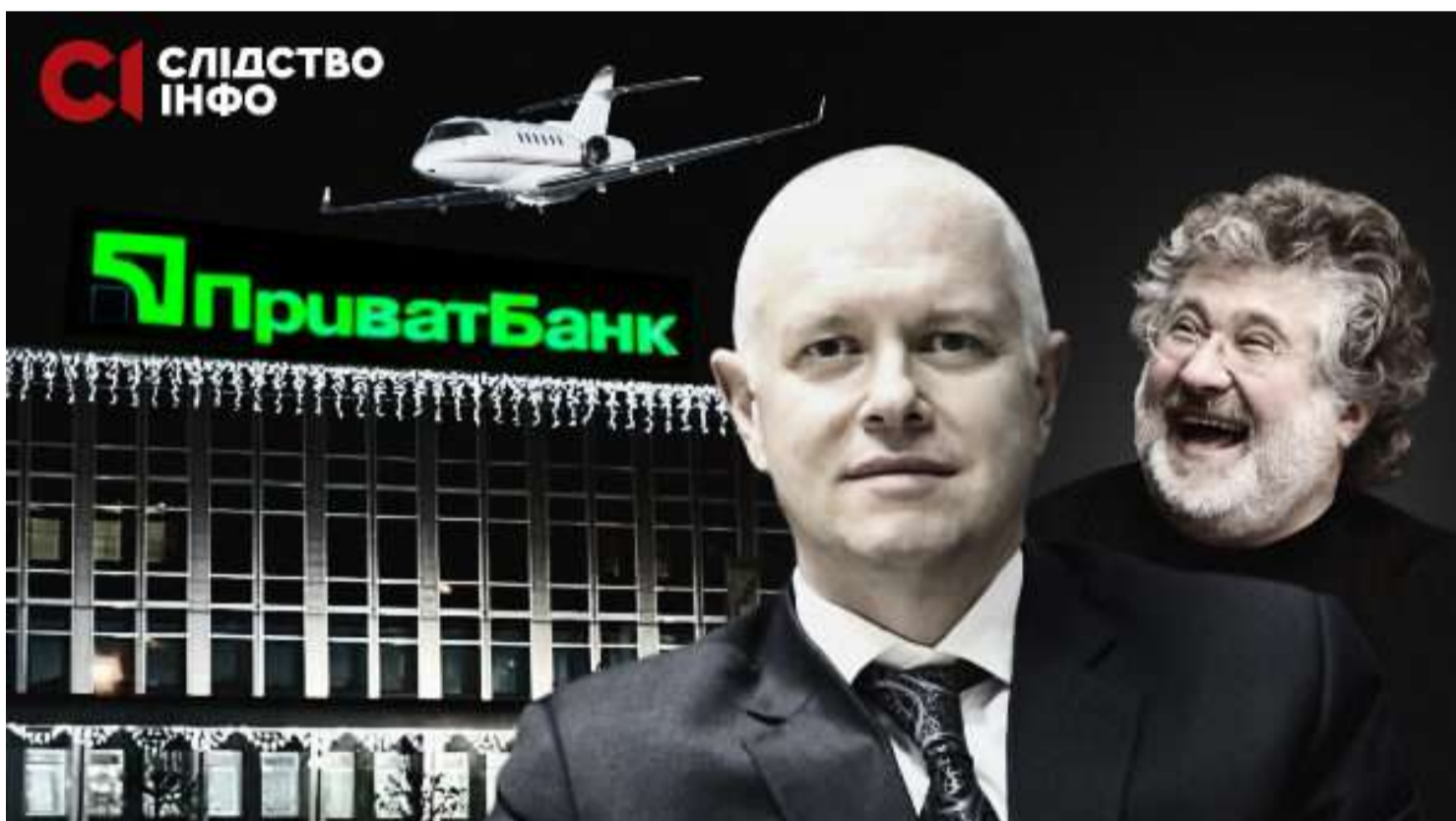
ПІСЛЯ ГУЧНОГО ЗАТРИМАННЯ КОЛИШНІЙ ТОП-МЕНЕДЖЕР «ПРИВАТБАНКУ» ПЕРЕПИСАВ НА РОДИНУ ДЕСЯТКИ МІЛЬЙОНІВ ГРИВЕНЬ