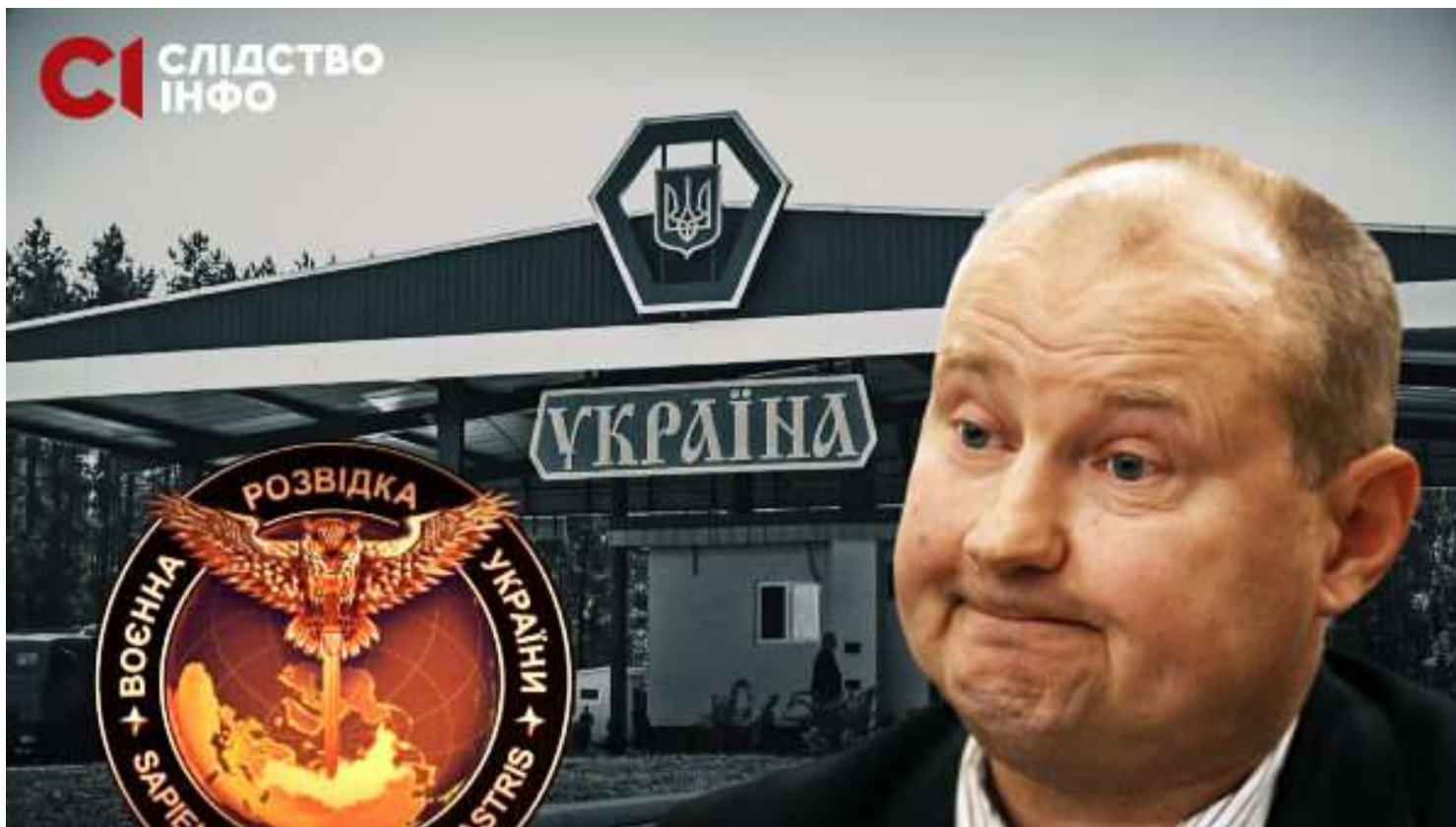
ПІДРОБНИЙ ПАСПОРТ І КРАЇНА ВИНА: ЩО ПОВ'ЯЗУЄ УКРАЇНСЬКИХ РОЗВІДНИКІВ ІЗ ВИКРАДЕННЯМ СУДДІ ЧАУСА