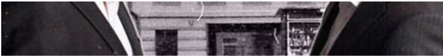
БУДІВЕЛЬНИЙ УДАР: ЯК БРАТ КЛИЧКА ПРИБРАВ ДО РУК СТОЛІТНІЙ ДІМ У ЦЕНТРІ КИЄВА