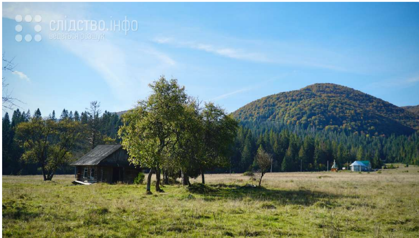
У 2014 році батько генерала поліції купив 7 ділянок у селі Річка. Загальна площа — майже 5,7 гектара. Село розташоване біля гори Кичера, і в майбутньому має всі шанси стати ще одним гірськолижним курортом Закарпаття. Слідство.Інфо

У 20 кілометрах від Пилипця розташоване інше гірське село Річка. Туристи тут бувають значно рідше. Проте, як пояснює експерт з нерухомості, місце для інвестицій дуже перспективне. Село розташоване біля гори Кичера, і в майбутньому має всі шанси стати ще одним гірськолижним курортом Закарпаття. У 2014 році батько генерала поліції купив тут 7 ділянок. Їхня загальна площа майже 5,7 гектара. Земля Олександра Ковалю розташована якраз у підніжжя гори й ідеально підходить для зведення котеджів або готельного комплексу. Щоправда, наразі жодних ознак будівництва тут немає.