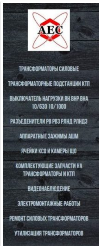
Прайс лист 01.02.2018 р. на трансформатори ТМ та КТП ціни від виробника