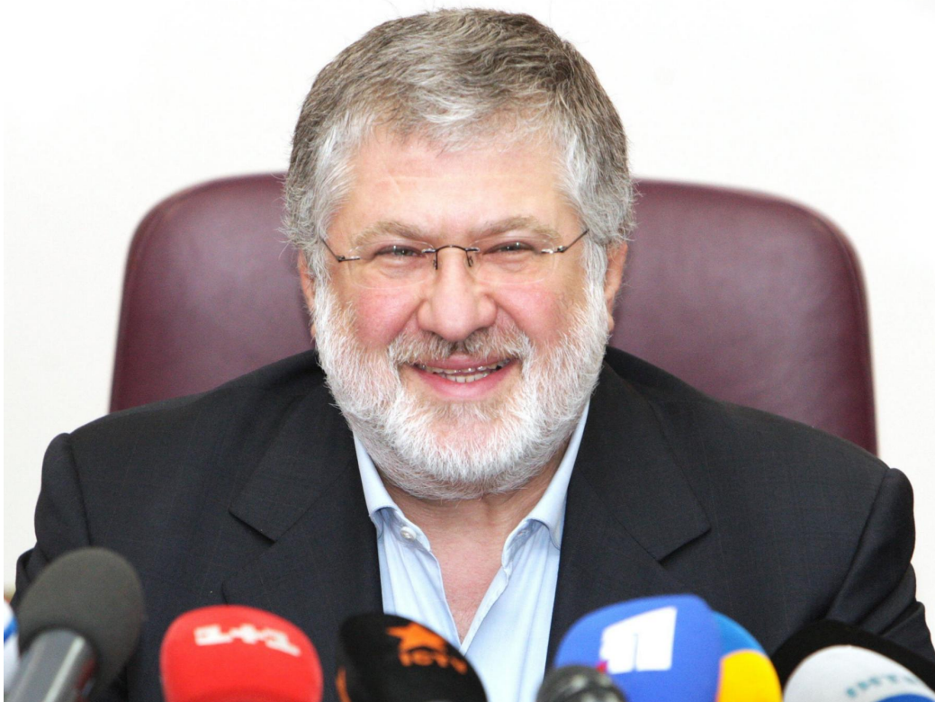
Игорь Коломойский в 2014 году.

«Основная цель руководства [Национального банка] состояла не в поддержке крупнейшего банка страны, а в национализации и экспроприации активов, предоставленных в качестве обеспечения, а также в преследовании и давлении на бывших акционеров», — высказал мнение Коломойский.