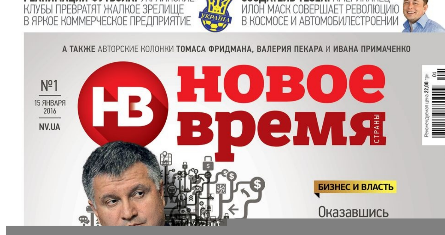
Обкладинка нового номера журналу Новое Время

Детально розслідування про сімейний бізнес голови МВС Арсена Авакова читайте в новому номері журналу Новое Время — №1 від 16 січня