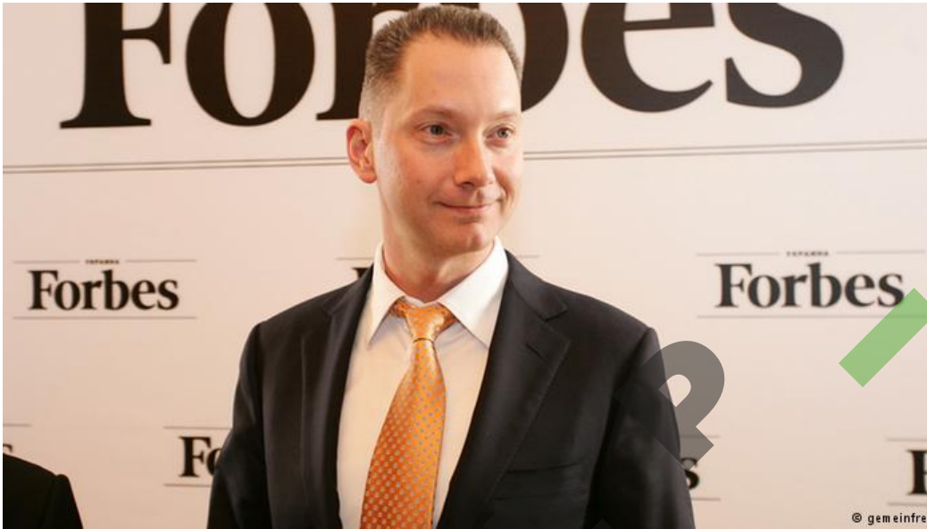
Нерухомість у Німеччині - перший проект Бориса Ложкіна, про який стало відомо після його повернення в бізнес

За дорученням президента Порошенка экс-голова його адміністрації Борис Ложкін залучав інвесторів в Україну. Сам Ложкін, як з'ясувалося, більш привабливою для інвестицій вважає, вочевидь, Німеччину.