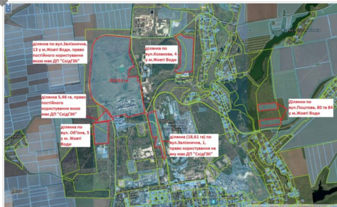
м Жовті Води, Дніпропетровська область. Дані Публічної кадастрової карти України