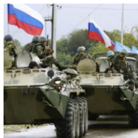
Повномасштабне вторгнення Росії в Україну