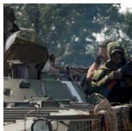
Бойовики здають позиції

Борьба в группировке «ЛНР»: Плотницкий победил? Плотницкий заявляет, что він в Росію не виїжджав