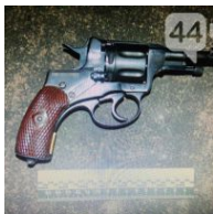
Полиция "накрыла" сходку криминальных авторитетов