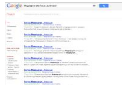
Рейтинги від "Фокусу"

1984-86 - інженер, Київ. мех. з-д. 1986-91 - заст. секретаря, секр. ком-ту комсомолу, Київ. мех. з-д; секр., Київ. МК ЛКСМУ. З