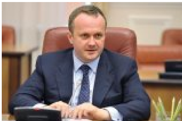
Рост тарифов неизбежен: власти предупредили украинцев