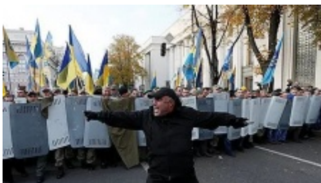
Лидер "Азова" Билецкий рассказал, кто и как свергнет власть