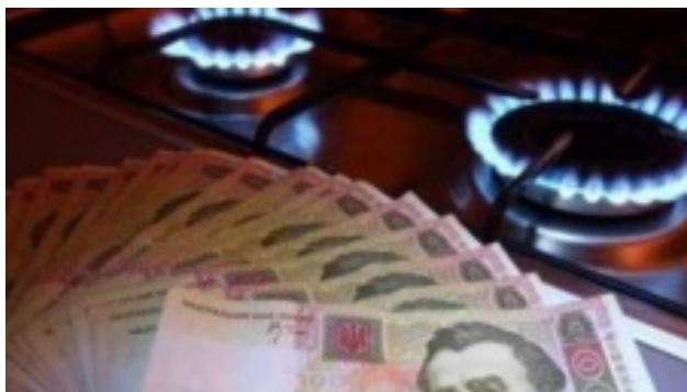
Украине поставили условие: что будет с ценами на газ для населения?