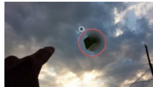
В небе над Украиной два дня подряд появляются странные объекты (видео)