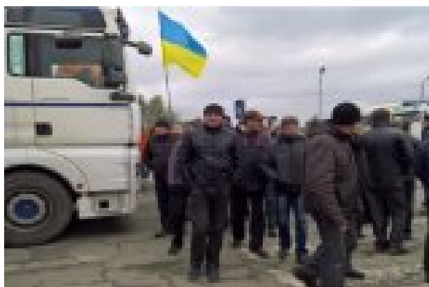
Дорогу из Украины в Польшу перекрыли