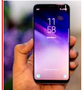
Samsung Galaxy S8 - доступной цене! ..