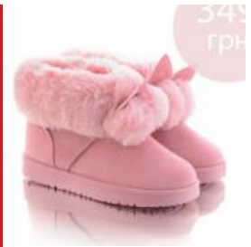
Женские угли по самой низкой цене

- Ні, екстрим не люблю. Та й з тренером - це вже не екстрим.