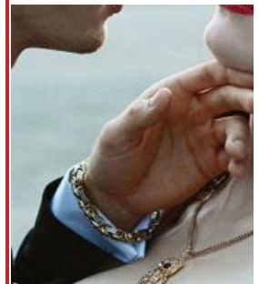
Специальное предложение для вас ...