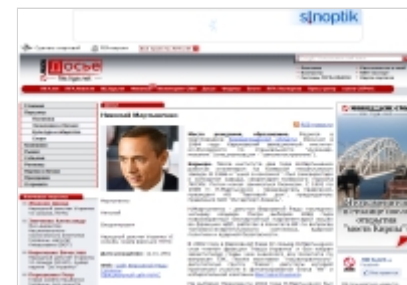
Досьє від "Ліга.нет"

Нар. деп. України 7 склик. 12.2012-11.14 від ВО "Батьківщина", N 17 в списку. На час виборів: нар. деп. Україна, б/п. Чл. фракції ВО "Батьківщина" (з 12.2012), голова Ком-ту з питань паливно-енергетичного комплексу, ядерної політики та ядерної безпеки (з 12.2012).